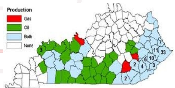
Counties in Kentucky

Wir, die Firma OMR OIL LLC, haben uns in den letzten 20 Monaten sehr stark entwickelt und unsere Aktivitäten auch auf Kansas ausgeweitet. Wir decken heute ein breites Spektrum des Ölgeschäftes ab, von kleinen „ein-Mann-Quellen“ bis zu „Multi-Quellen-Programme“ für Institutionen und Fonds Gesellschaften. Eine Bohrung kostet je nach Tiefe und Bundesstaat zwischen 200.000 und 1.000.000 Euro. Wir tragen im Regelfall zwischen 68-76% der Kosten und Risiken, pro Projekt. Die restlichen 24-32%, je nach Projekt werden Prozent Weise an Interessenten verteilt. Mit dieser Aufteilung setzen wir Projekte schneller um, wachsen dynamischer und können uns neue Projekte sichern.